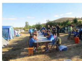
Acampada de Argaño