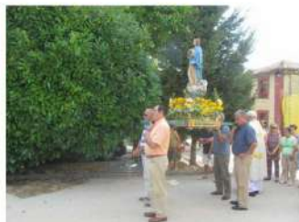
Procesión de Ntra Sra, año 2017