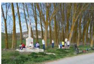
Semana Santa 2017, en el Puente