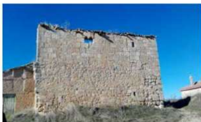
Restos del antiguo monasterio de San Martín de Rocamador