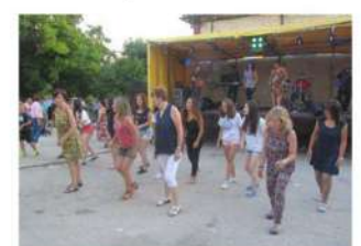
Bailando al mismo son