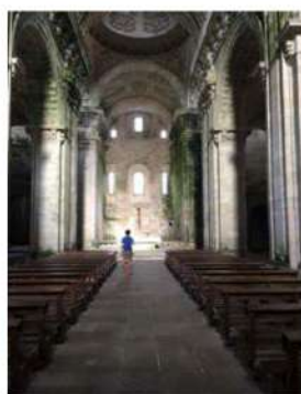
Monasterio de Sobrado dos Monxes.