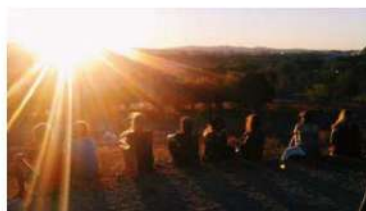
Atardecer en el monte do Gozo, dos días antes de llegar a Santiago.

Es una ruta con menor popularidad que la tradicional francesa, por ello hay menos gente y durante alguna etapa es posible no llegar a cruzarse con otro peregrino, aunque siempre encuentras a un grupo de en torno a 40 personas al final de etapa en cada albergue. Cada año gana más popularidad sobre todo en meses de verano