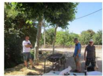
Los cocineros, preparando las chuletas