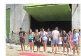
Parque de agua con los jóvenes