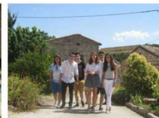
Los "medianos", Fiestas 2016