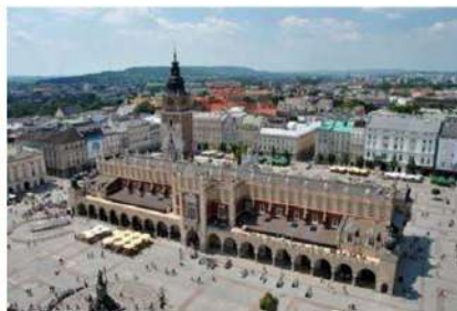
Plaza Mayor de Cracovia, la mayor en tamaño de Europa