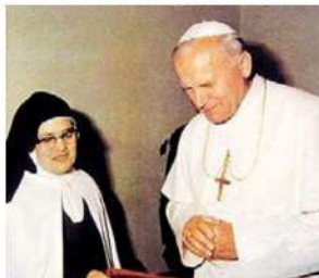
Juan Pablo II y Beata Sor Lucía