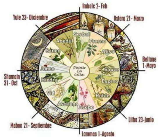
Calendario Celta con un árbol para cada mes

Fábulas En las bodas, se distribuían avellanas como símbolo probable de la generación; y en un cuento popular de la Toscana, la joven desposada encuentra a su marido que una bruja había raptado, mediante una avellana prodigiosa. En general, año de avellanas, será año de muchos partos y niños en el pueblo.