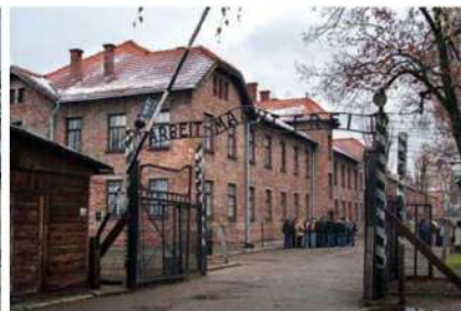
Portada del campo de concentración de Auschwitz a 40 km de Cracovia

Cisco Systems es una empresa americana de tecnología de redes de telecomunicación, en Cracovia tiene asentada la base para EMEAR (Europe, Middle East, Africa and Russia) de los programas de prácticas. Yo he participado en un programa de ANCE (Associate Network Consulting Engineer) es un programa donde hemos participado 22 personas procedentes de diferentes países entre ellos Sudáfrica, Alemania, Egipto o Arabia Saudí. Durante estos seis meses nos hemos enfocado en recibir sesiones de preparación tanto técnica como de desarrollo de herramientas para la productividad (softskill) que a la vuelta en Madrid nos van a ayudar para desarrollar un trabajo de consultoría tecnología.