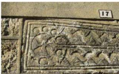
Dintel, hecho con un piedra visigoda