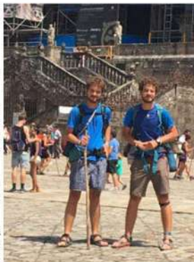
Llegando a Compostela

Creo que si tienes el tiempo necesario para aunque sea caminar durante diez días o dos semanas deberías de lanzarte a esta experiencia, pues te encantará. Os deseo de antemano un Buen Camino y "Ultraia et Suseia" ("Ultraia" (más allá) era el saludo dado al peregrino en la edad media, al cual este respondía siempre "et suseia" (y más arriba)).