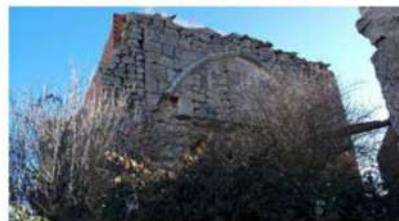
Restos del Monasterio de San Martín de Rocamadour (I).