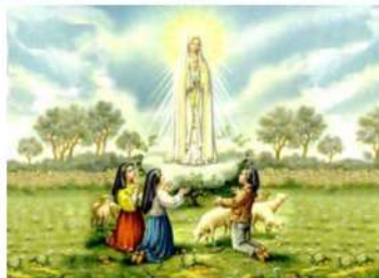
Aparición de la Virgen