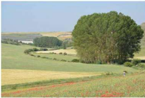
Vista desde Fuente las Brujas