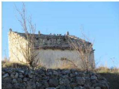
Palomar del Castillo, del Molinillo y de San Juan.