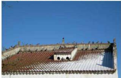
Palomar de Carlos y Mercedes en el propio pueblo