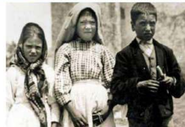
Jacinta, Lucía y Francisco

En 1917, en las inmediaciones de la pequeña aldea agrícola de Fátima, en Portugal, ocurrió la manifestación religiosa más famosa de todo el siglo XX: la llamada aparición de la Virgen de Fátima, que ocurrió en un difícil contexto en el mundo. La Primera Guerra Mundial desangraba a Europa, conduciendo a la humanidad a la forma más salvaje de guerra vista hasta ese momento, mientras que en Rusia Lenin preparaba la revolución marxista y atea que volcaría no sólo el orden social ruso, sino que también sumergiría eventualmente a casi la mitad de los habitantes del planeta. Por ello, los creyentes asegurarían más tarde que la Virgen se apareció para interceder por la humanidad y para proveer con su mensaje el antídoto para los males morales y sociales del mundo.