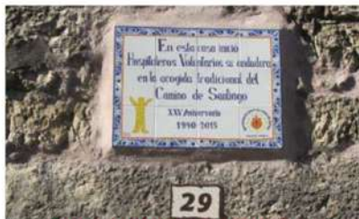
Casa de acogida a peregrinos

Llegamos a la plaza, en verdad recoleta y, lo primero que vemos es la fuente, obra de los años ochenta de hace dos siglos; tres cuerpos: pilón, zona media con dos caños y remate con un achaparrado obelisco, "pobo de atracción de la luzdivina", adornado con el escudo de Castilla y León y rematado con un emplumado gallo ostentando la fuente de su mismo nombre; su presencia responde al eco de una leyenda que tiene que ver con el paso de la francesada; su figura, junto con la de un puente, aparece en el escudo del pueblo. Esperemos que éste, su tercer emplazamiento, sea el definitivo