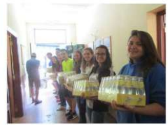
Trabajo en cadena, el suministro del bar