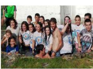
A remojo en las dianas del 2016