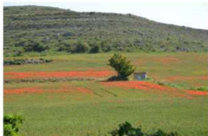
Captación de agua de Fuente las Brujas