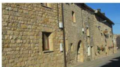
Casas con arcos en la calle principal.