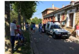
Preparando todo para San Quirico.