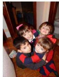
Biznietos de Filo

¿Cómo han ido cambiando las casas y las comodidades en el pueblo, desde que usted se casó hasta ahora?