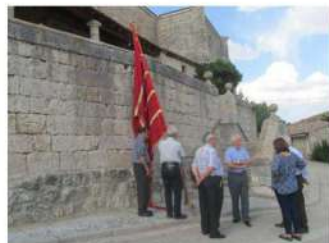
Preparando el Pendón