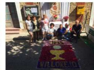
Corpus, terminando la alfombra de flores