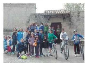
Excursión en Bici a la Ermita de Argaño