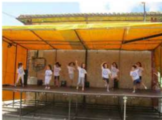
Baile preparado por los más pequeños.