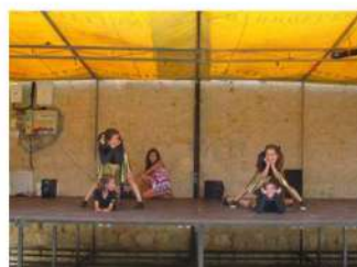
Número de danza con las más jóvenes