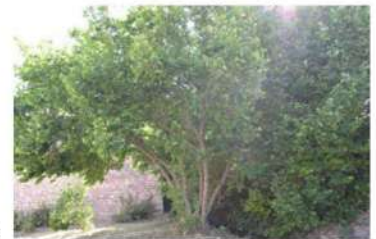
Avellanos en el río Humayor