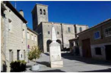
Plaza de la Iglesia y monolito