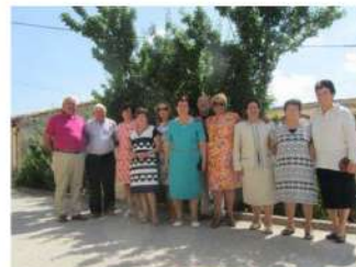
En familia, tras la Misa del día 15