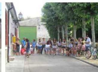
La Tuta de Mujeres