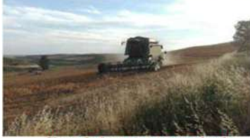
Siega de forrajes y cosecha de Guisantes en junio y Julio 2017

El año ha sido uno de los más secos en Invierno y Primavera en toda la zona Norte y Centro de España. Toda la Meseta del Duero ha sufrido una de las peores sequías de los últimos lustros (el cauce de nuestro río Hormazuela, está seco en Isar), y la poca lluvia de la Primavera ha hecho que en muchas provincias castellanas, no se hayan cosechado los campos, por que no ha merecido la pena.