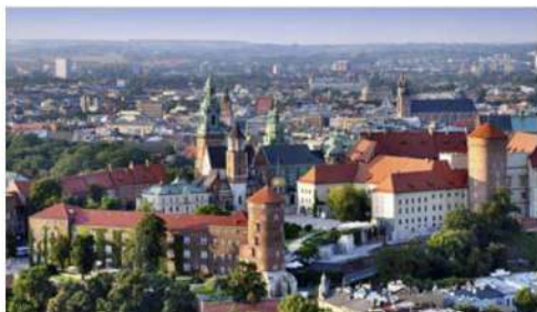
Vista del Castillo y Catedral de Cracovia

Es una ciudad muy famosa tanto para estudiantes Erasmus como para turistas debido a que en general el precio de la vida es muy barato. Tanto el centro histórico como el Barrio judío (Kazimierz) están plagados de cafeterías, tiendas y pubs que siempre están llenos de gente local y extranjera. La moneda de Polonia es el zloty (1 euro = 4 zł); es una moneda bastante segura (no sufre grandes subidas o bajadas) pero muy devaluada. Últimamente el gobierno está favoreciendo leyes económicas con la intención de atraer la inversión de empresas extranjeras, centrándose sobre todo en empresas del sector tecnológico, por ello la ciudad está en constante construcción y rejuvenecimiento