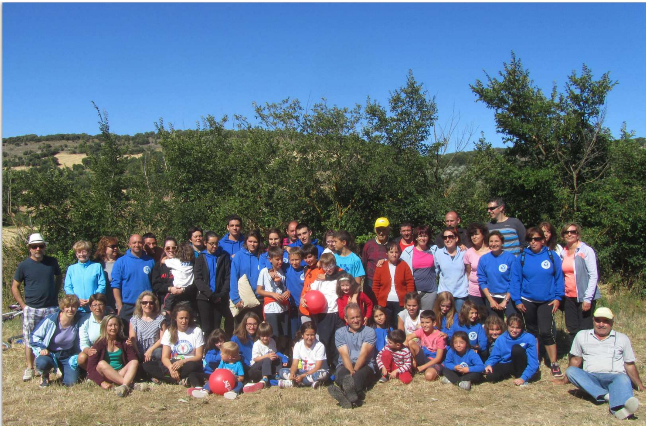
Acampada en Ntra. Sra. De Argaño, Agosto 2016