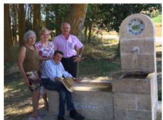
Verano 2016, pasco hasta el Puente