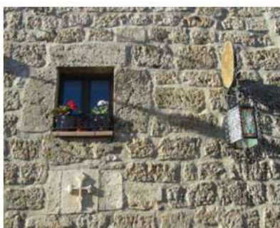
Albergue de peregrinos