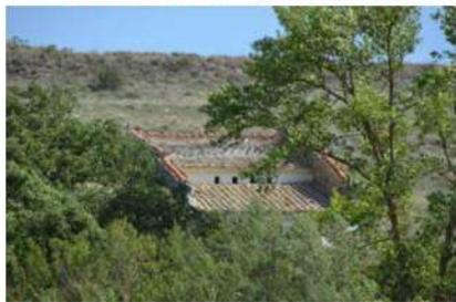
Palomar de Máximo en el Molinillo