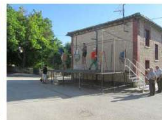
Montando el escenario