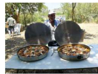
Las paellas de San Quirico