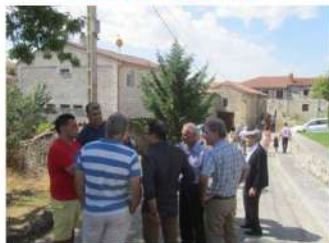
A la sombra , charla tras la Misa