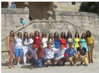
Los jóvenes tras la Misa de las Fiestas