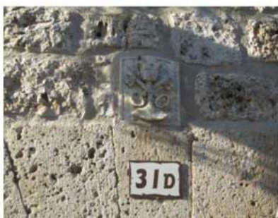
Detalle de casa blasonada con Cáliz y llaves