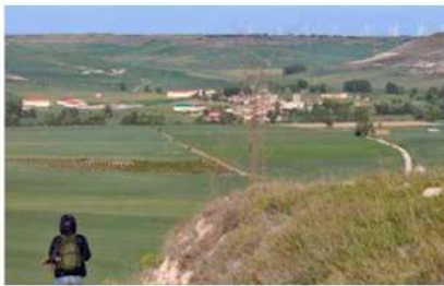
Peregrino llegando a Hornillos desde Burgos

A Hornillos, a 2,5 kilómetros de Isar, dirección sur se llega por el viejo camino de Carresitillos, o también por la orilla del río Hormazuela de curso breve, de aguas tranquilas en verano y caudalosas e invasoras en el invierno y en la primavera. Santa Teresa de Jesús nos dejó escrito en el libro de las Fundaciones sus miedos y peligros en el paso de los pontones de Celada en su viaje fundacional a Burgos (enero 1582). En este punto el Hormazuela rinde su curso al Aranzón.