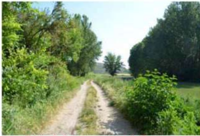
Inicio de la ruta : camino de Humayor