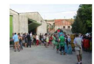
Disfraces año 2017