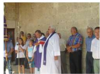
Misa por nuestros difuntos