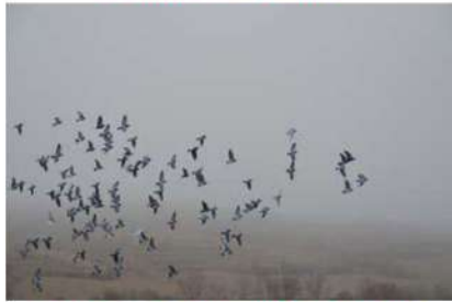
Palomas en Villorejo Navidad 2016