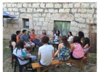
Reunión y charla de los Jóvenes