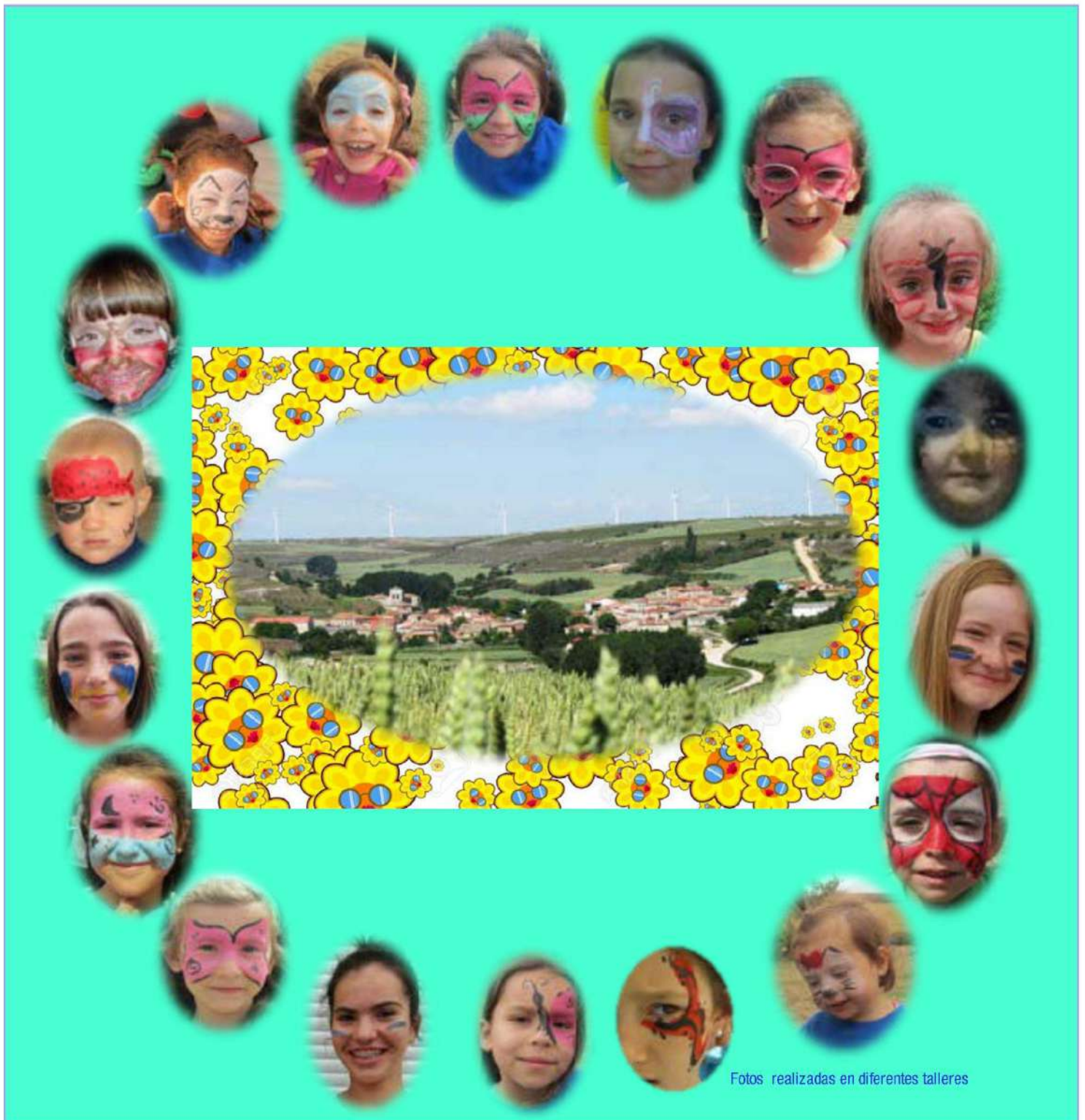
Fotos realizadas en diferentes talleres