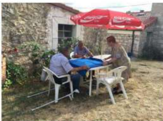
Partida en el corral