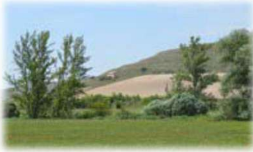
Palomar de la Penilla