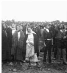
Milagro del sol