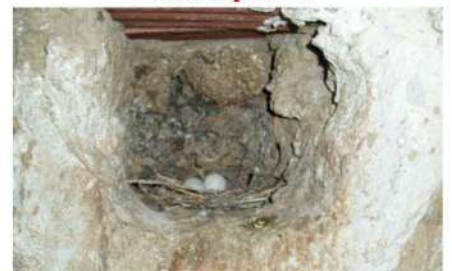
Nido de paloma.