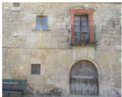
Detalle de casa con portada arqueada