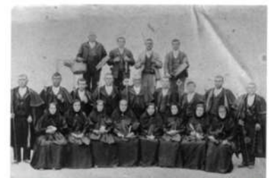
Cofradía del Santísimo en Iscar Valladolid