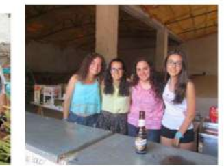
Tras la barra , tumo de bar en el vernmouth