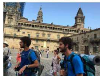
Llegada a Santiago, en la catedral superior y en la Plaza del Obradoiro