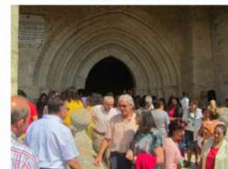
Salida de Misa día 15