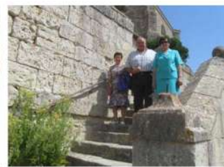
Cerrando la Iglesia tras la Misa